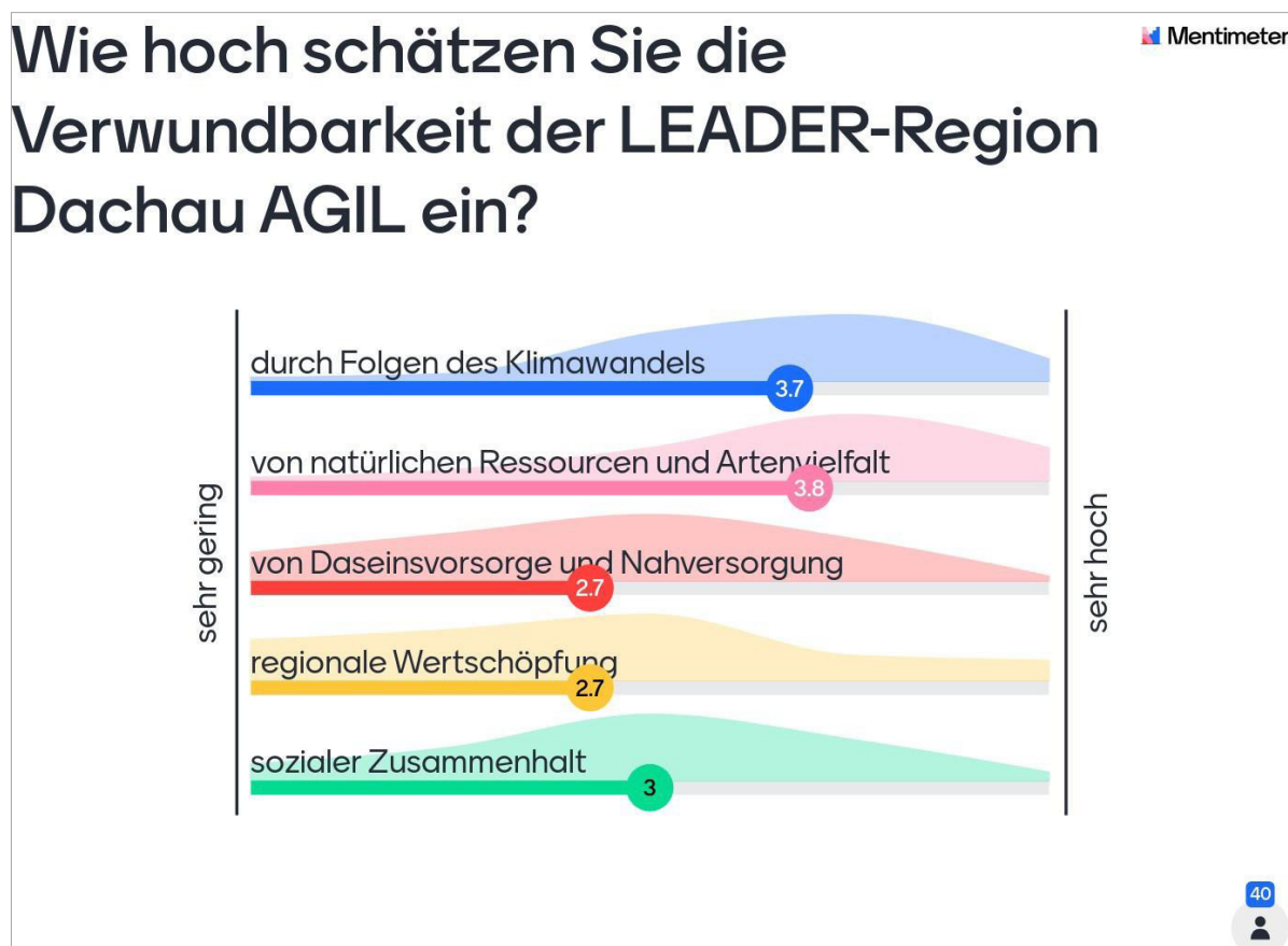
Abbildung 6: Ergebnisse Verwundbarkeitseinschätzung