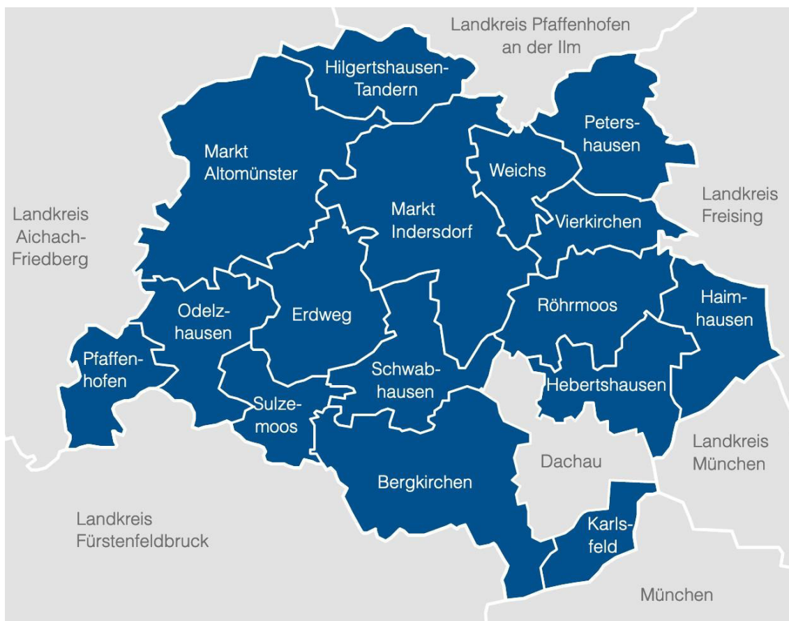
Abbildung 4: Das LAG-Gebiet

In der Region gibt es zahlreiche Initiativen, die intensiv in die Erarbeitung der LES mit eingebunden waren. Kommunale Allianzen bzw. ILEs oder eine Ökomodellregion gibt es in der Region (noch) nicht. Die Aufgaben einer Regionalmanagementorganisation werden über den Verein Dachau AGIL geleistet, ohne das Förderinstrument „Regionalmanagement“ zu nutzen.