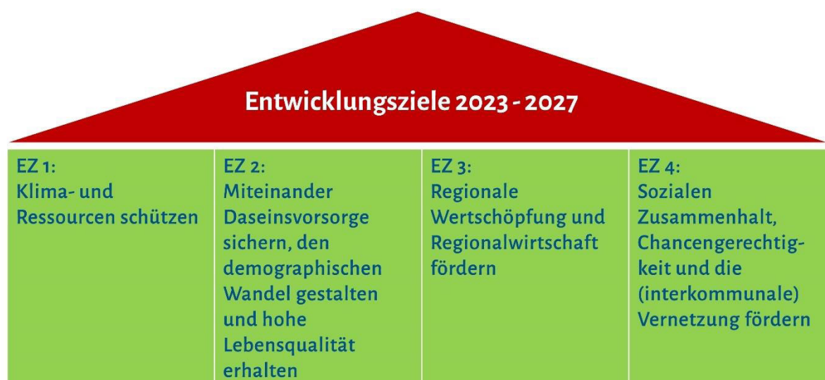
Abbildung 1: Übersicht Entwicklungsziele 2023 - 2027

Die Entwicklungsziele sind aus den Ergebnissen und Erkenntnissen der SWOT-Analyse und einer Verwundbarkeitseinschätzung abgeleitet und mit den relevanten Themen dargestellt. Das Thema resiliente Entwicklung wurde dabei berücksichtigt und immer darauf Bezug genommen.